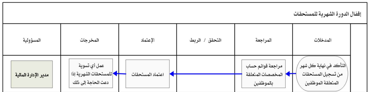
شكل رقم / ٥

يوضح المخطط البياني التالي (شكل رقم ٥) طريقة تسلسل العمل لإقفال الدورة الشهرية للمستحقات :